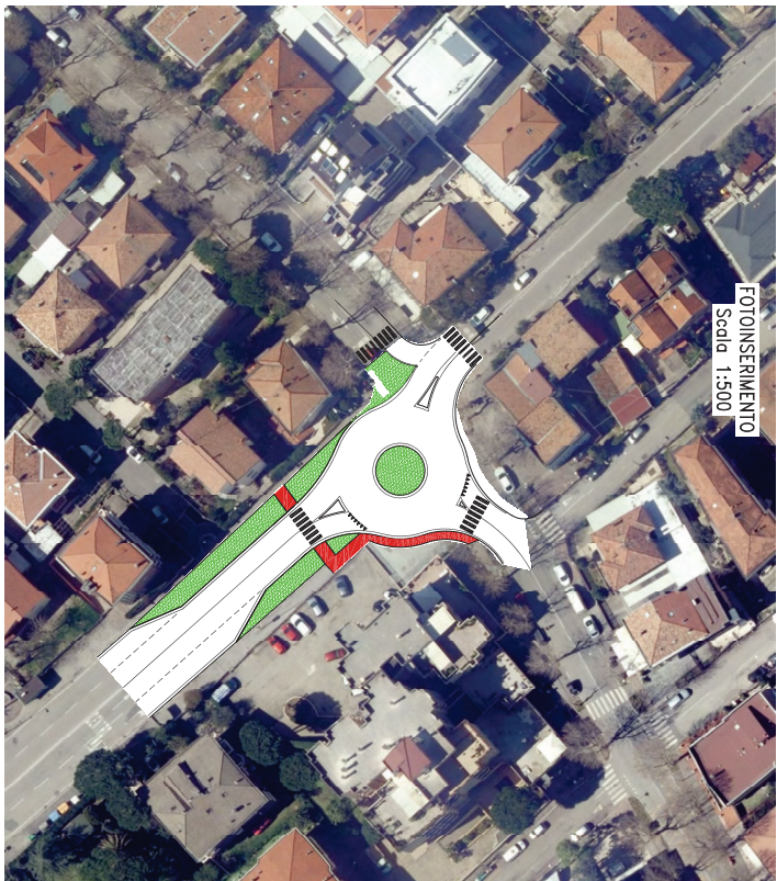
FOTONSERIMENTO Scala 1:500