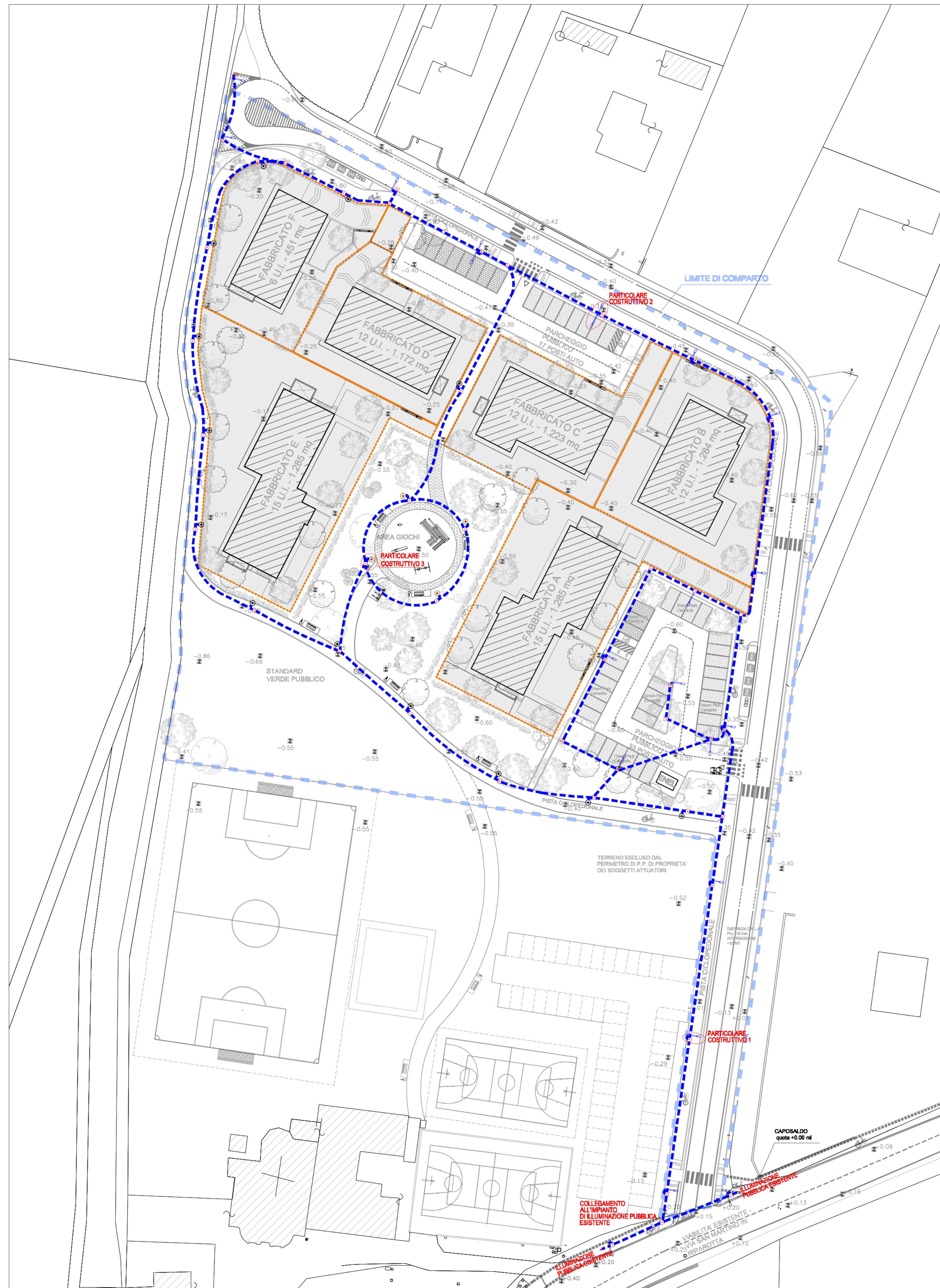
PLANIMETRIA GENERALE - SCALA 1:500