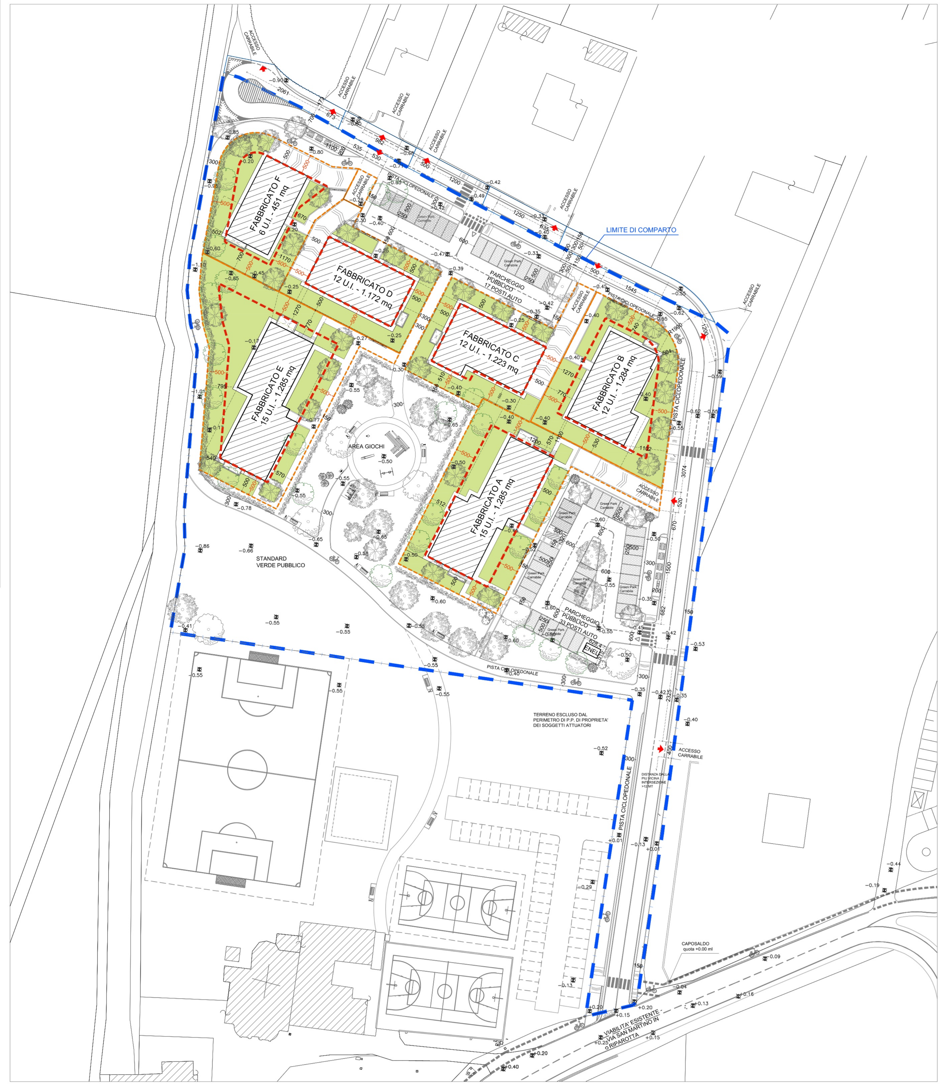
PLANIMETRIA GENERALE - SCALA 1:500

Fg.51 mappale 297 - 1341 (PARTE) SCALA: 1:500 DATA: OTTOBRE 2014 MASSIMO FRATERALI ARCHITETTO Studio Via Flaminia 86 RIMINI tel.0541-307876 fax0541-302622 e-mail architetto@fraterali.net