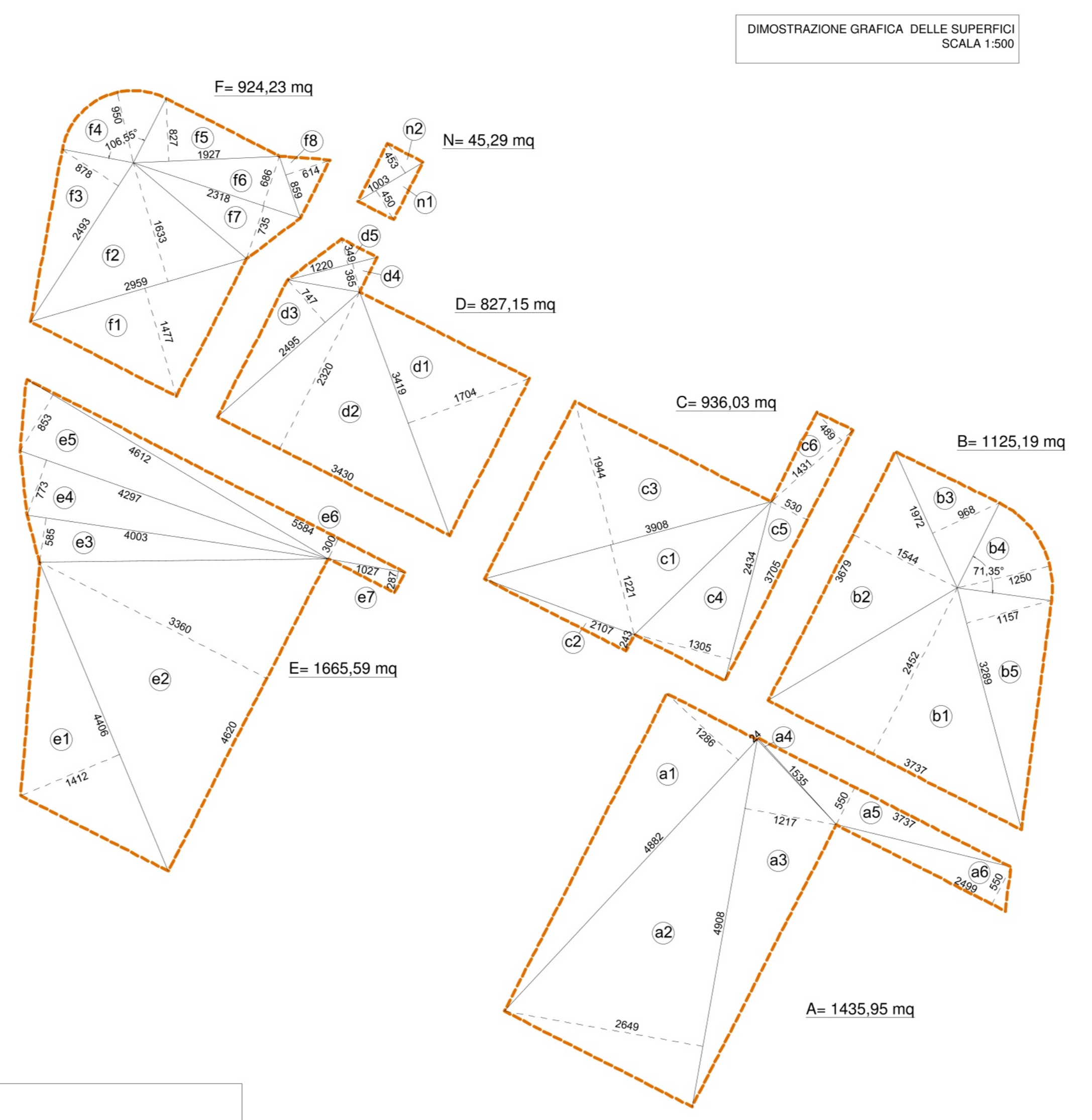
DIMOSTRAZIONE GRAFICA DELLE SUPERFICI SCALA 1:500