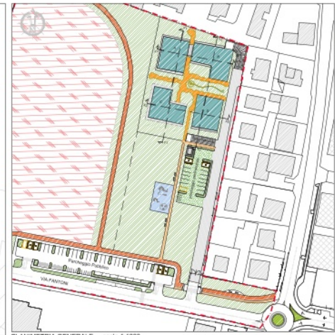
PLANIMETRIA GENERALE - scala 1:1000

NTA - Art. 8: Piano interrato ed autorimesse degli edifici. Ai sensi dell'art. 21 del "Piano Stratico di Boccio per l'Assente Idrogeologico (P.A.I.) Variante 2016", (deliberazione del Comitato Istituzionale n. 1 del 27/04/2016, pubblicata sulla Gazzetta Ufficiale in data 29/04/2016); "L'autorità di Bacino Distrettuale, proficua una direttiva per la sicurezza idraulica in Pianura in relazione al rischio di Bonifica. Nelle more dell'attuazione di quanto previsto al punto precedente, quali misure di salvaguardia immediata: vietando all'Adozione del presente progetto di variante al P.A.I., nelle aree soggette ad alluvioni frequenti (elevata probabilità-P3, come quelle in oggetto) e vietata la realizzazione di vari interrati accessibili". Pertanto, la rappresentazione di vari interrati nella tavola di P.P. è puramente indicativa e si rimanda alla legislazione di settore vigente al momento della presentazione degli atti abilitativi relativi ai fabbricati.