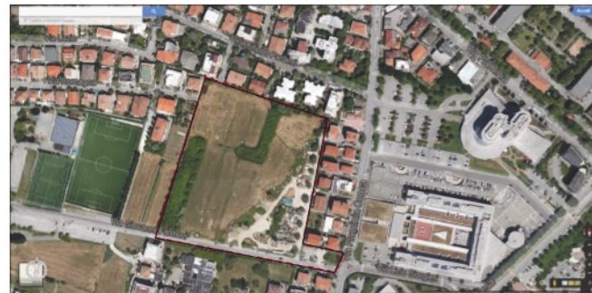
INDIVIDUAZIONE AREA scala 1:2000