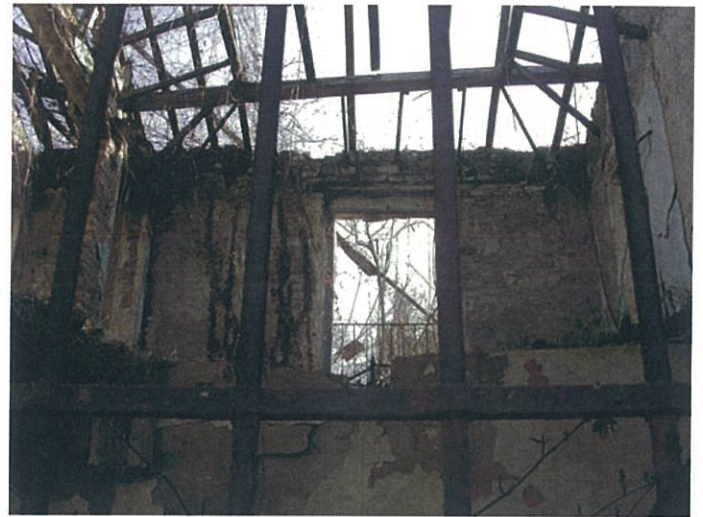
17. via Fattori, interno edificio