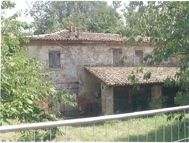
31. Ex mulino