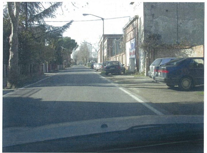
4. via Marconi