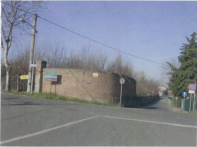
1. Incrocio via Marconi/via Amati/via Sacramora