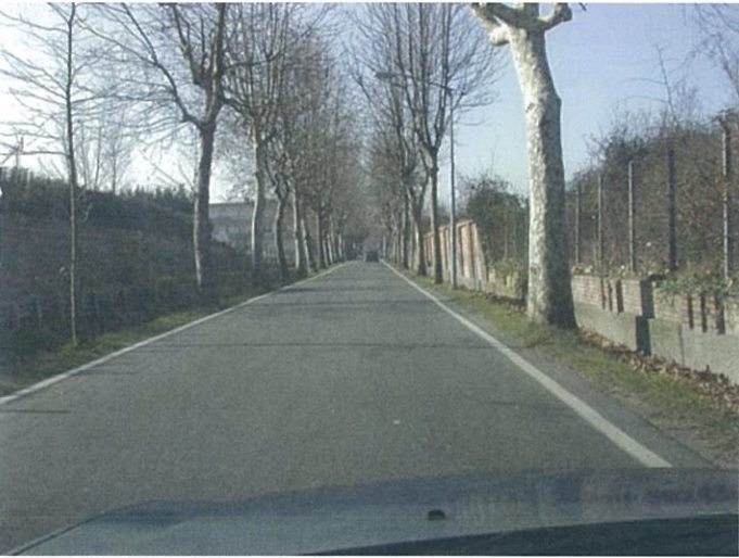
3. via Marconi