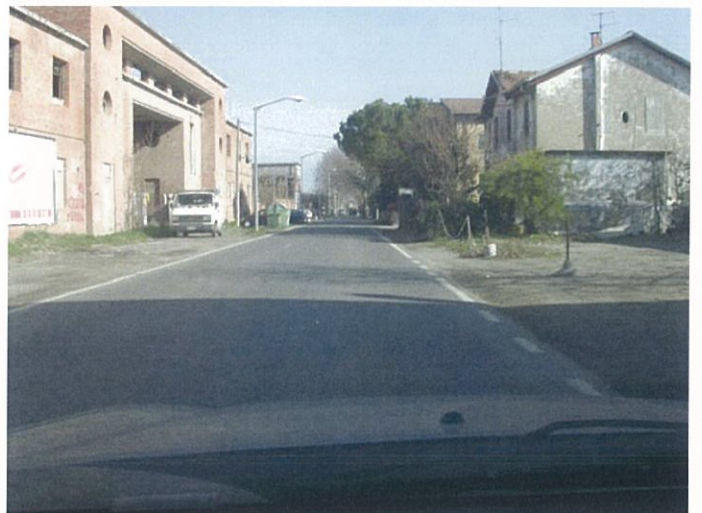
9. via Marconi