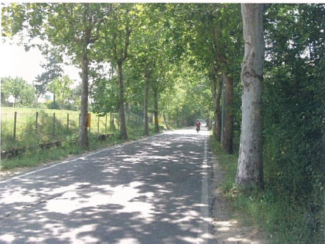
35. Via Marconi lato monte