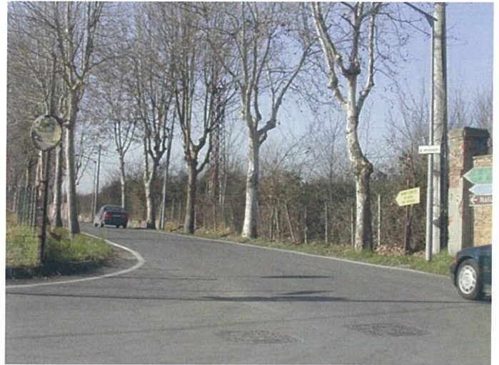
2. via Marconi