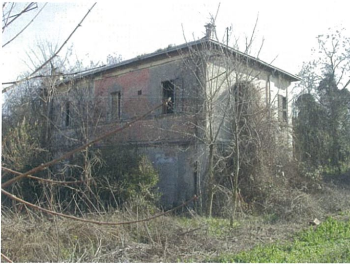
13. villino via Fattori