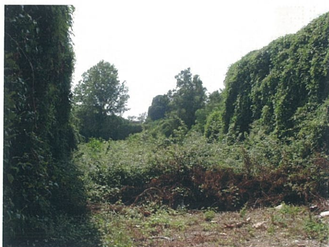
39. Vegetazione spontanea