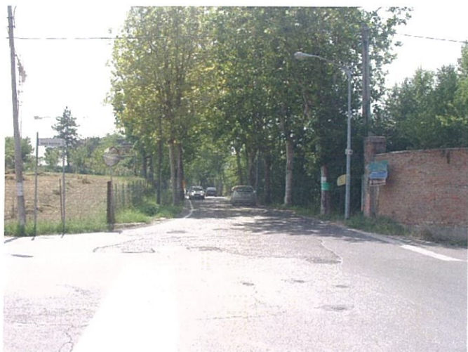
36. Incrocio via Marconi e via Amati