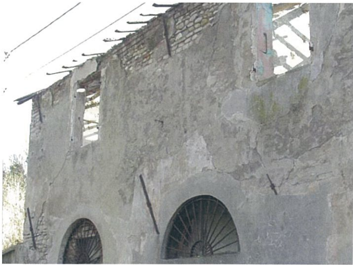
16. via Fattori