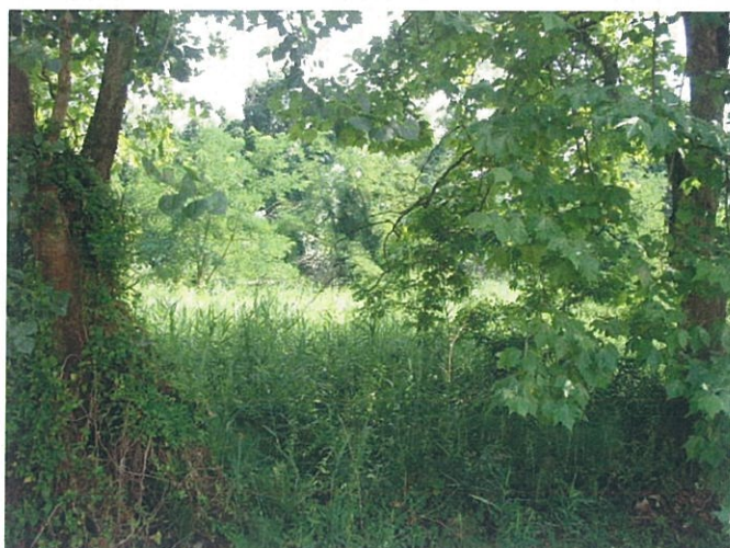
40. Vegetazione pseudopalustre