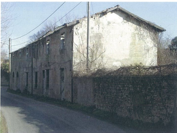
15. via Fattori