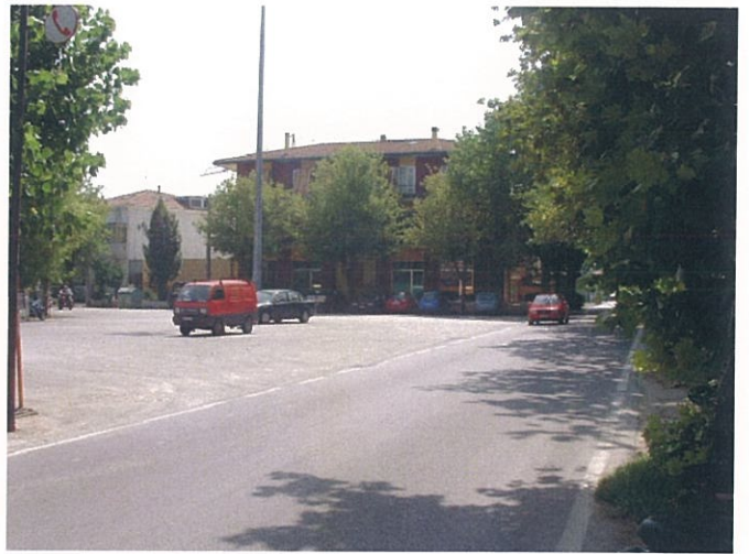
32. Largo fratelli Rosselli