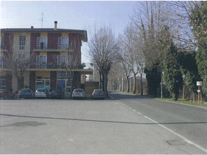
8. Largo F.lli Rosselli