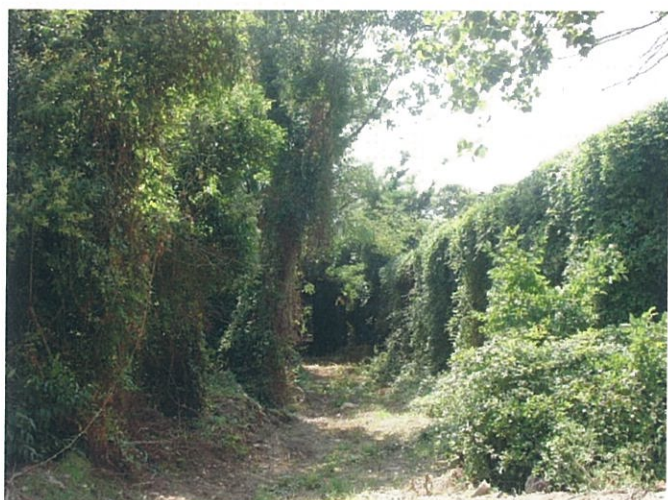
38. Vegetazione spontanea