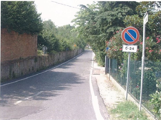
33. Via Amati