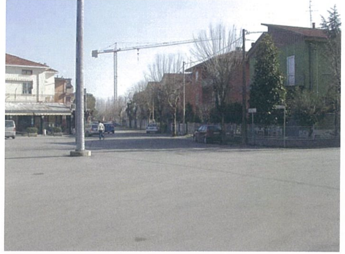
7. Largo F.lli Rosselli