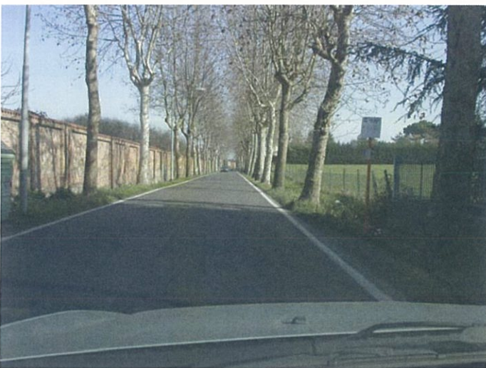
10. via Marconi