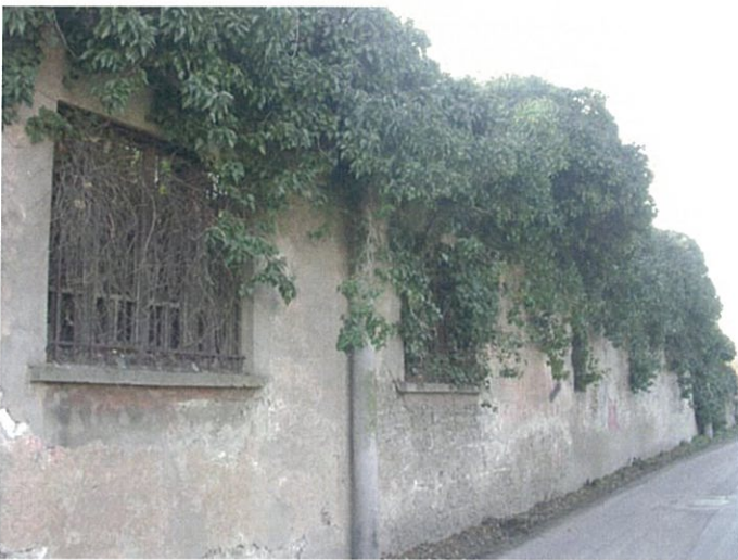
18. via Fattori