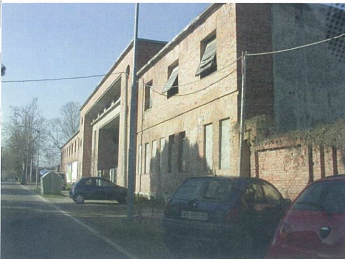
5. via Marconi