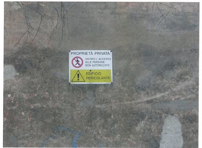
19. edificio in via Fattori