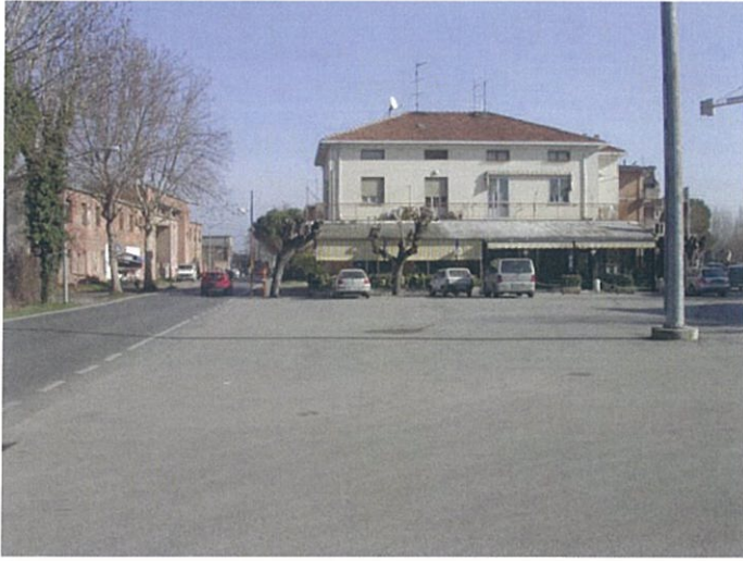
6. Largo F.lli Rosselli