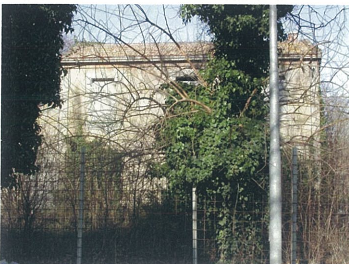
20. edificio in via Marconi