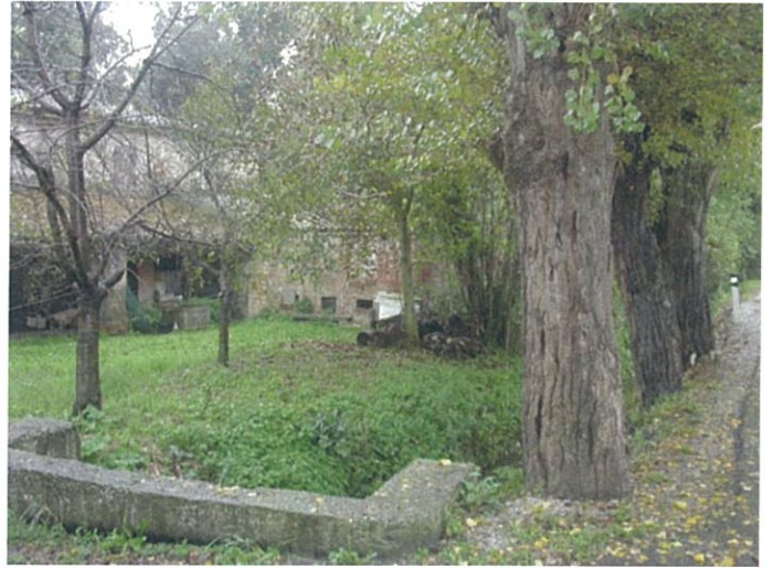
12. Il mulino