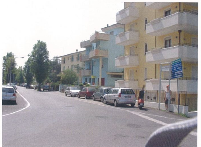
34. Via Marconi lato mare