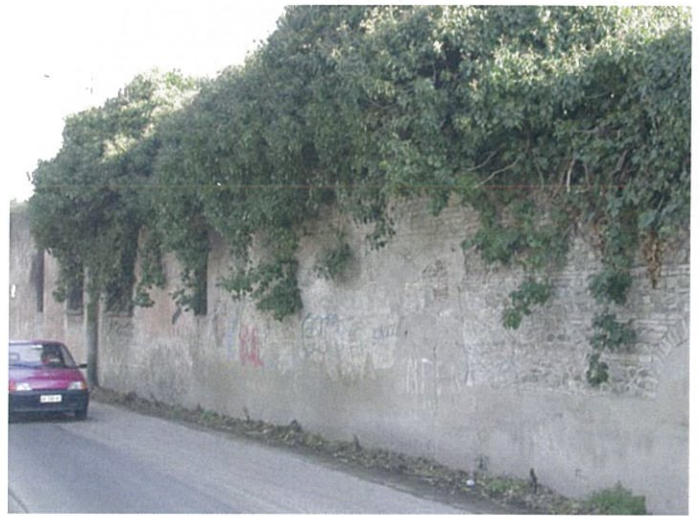
14. via Fattori