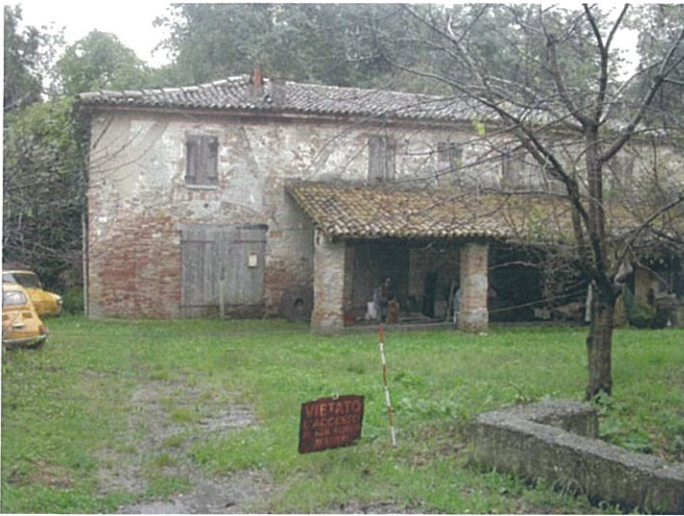
11. Il mulino