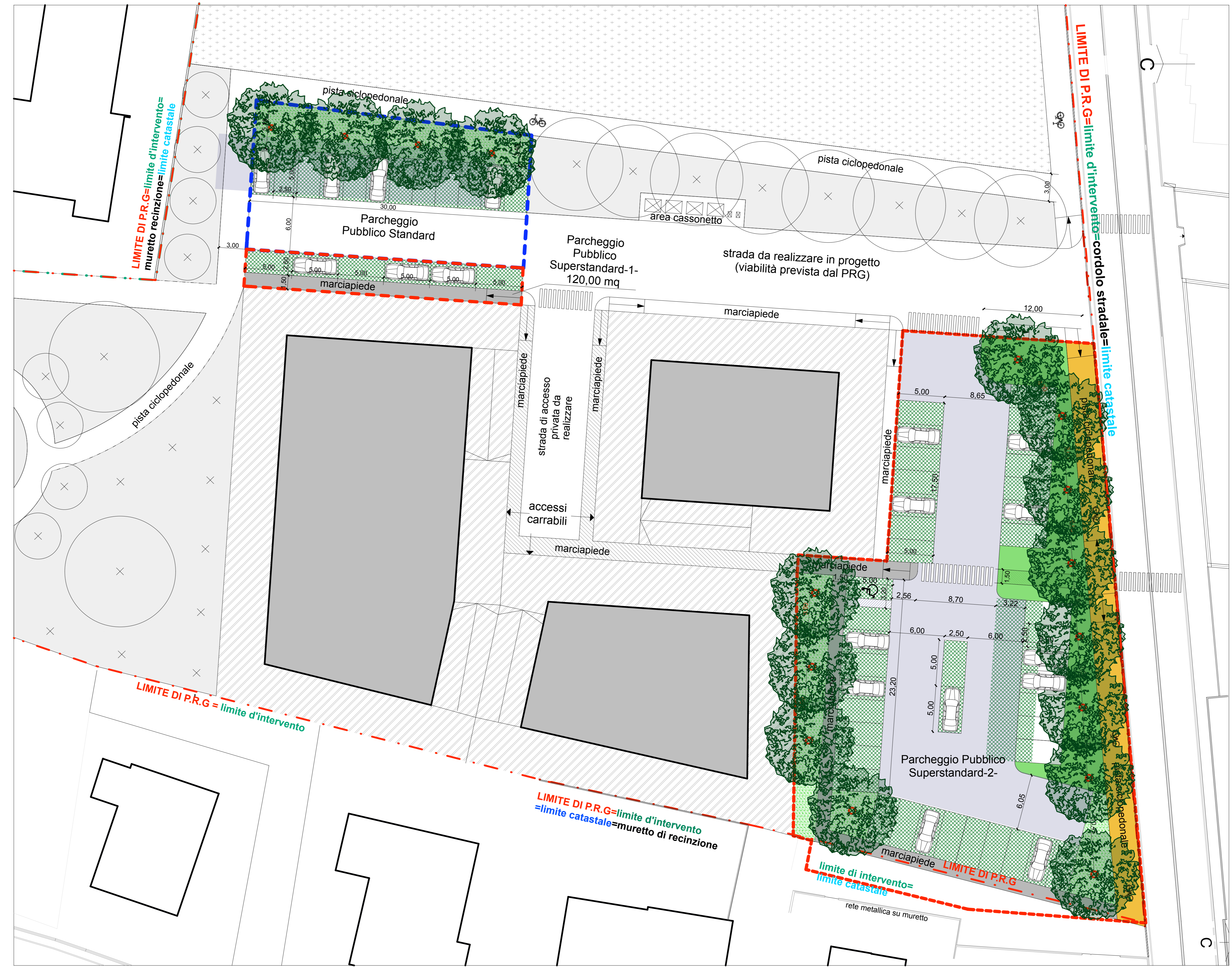
PARCHEGGIO PUBBLICO STANDARD E SUPERSTANDARD SCALA 1:200