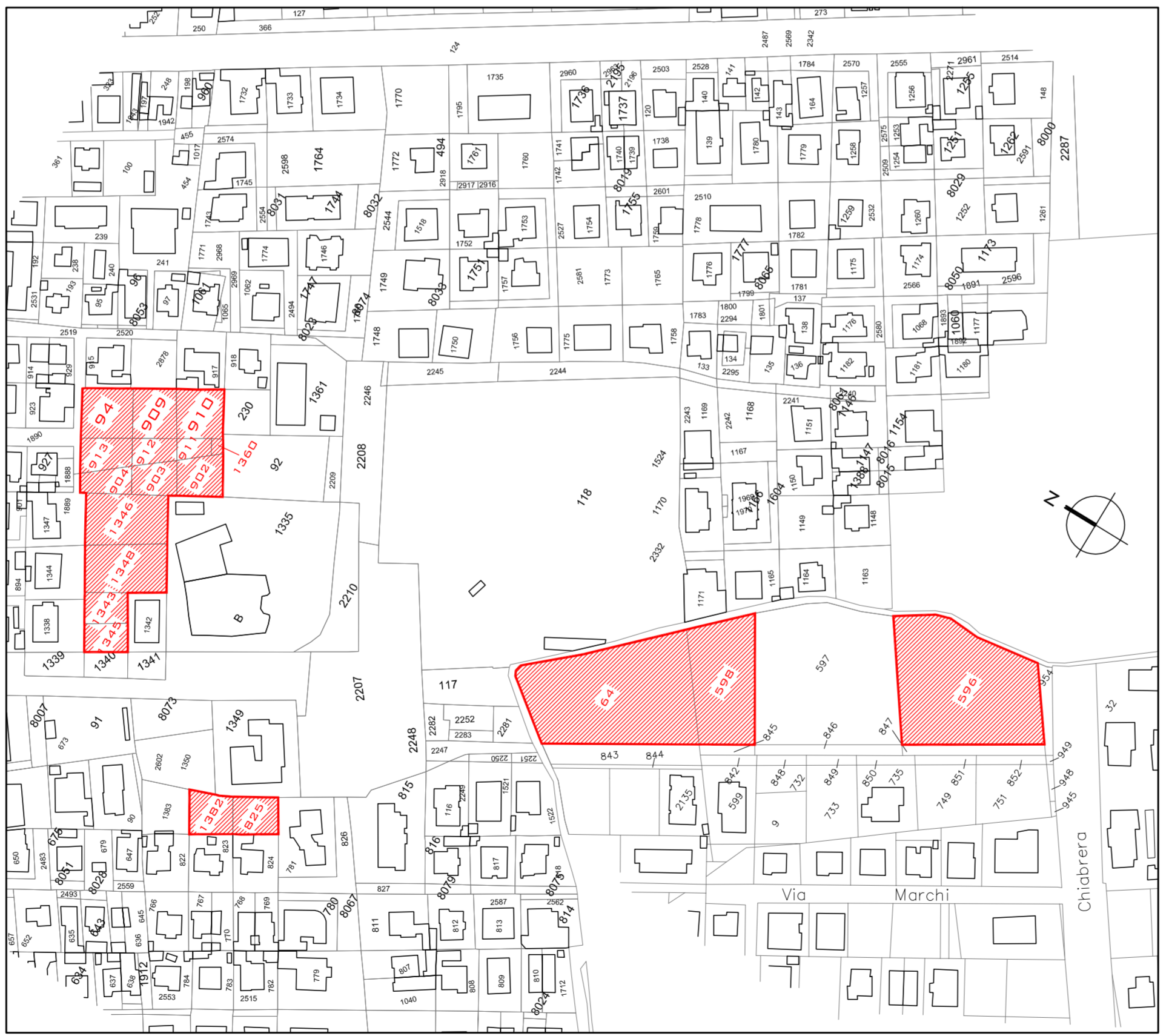
PLANIMETRIA SCALA 1:2000 FOGLIO N° 88 - PART. 94-902-903-904-909-910-911-912-913-1360-1346-1348-1343 1345-825-1382 FOGLIO N° 99 - PART. 64-596-598