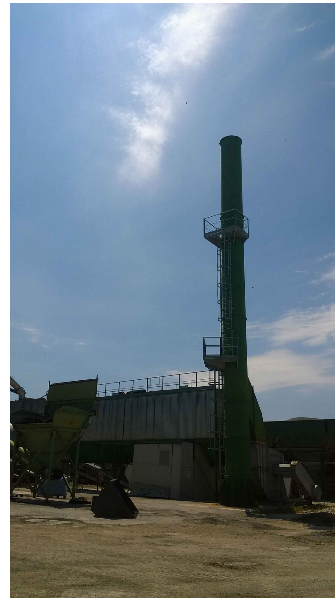
DOCUMENTAZIONE FOTOGRAFICA IMPIANTO DA DEMOLIRE