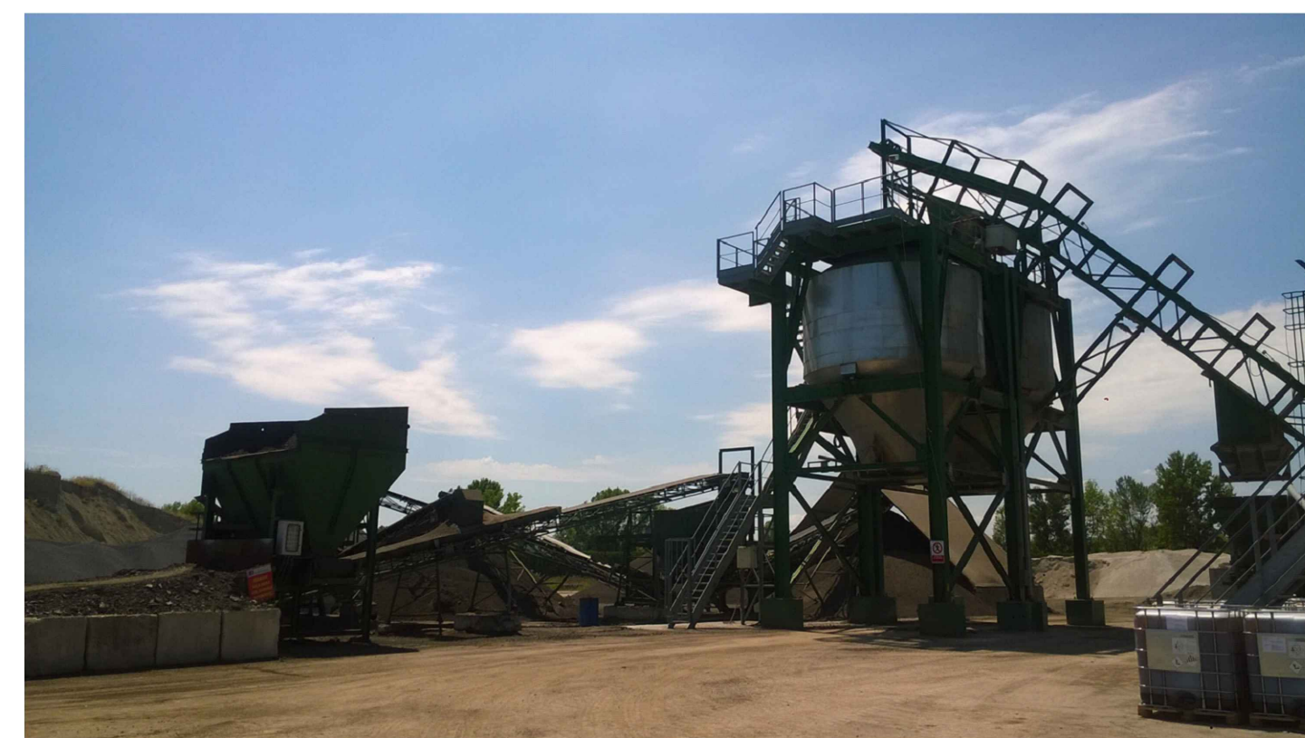
DOCUMENTAZIONE FOTOGRAFICA IMPIANTO DA DEMOLIRE