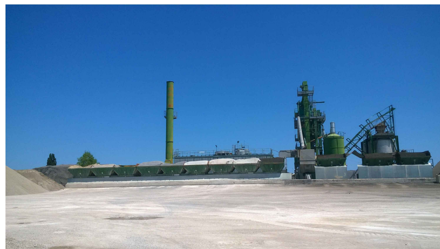
DOCUMENTAZIONE FOTOGRAFICA IMPIANTO DA DEMOLIRE