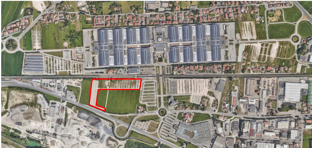
Fig. 1 – Inquadramento generale

L'intervento di progetto prevede la sistemazione di un'area già utilizzata a parcheggio dal polo fieristico, ubicata subito a sud della linea ferroviaria Bologna Ancona, così come evidenziato nella sottostante fig. 1.