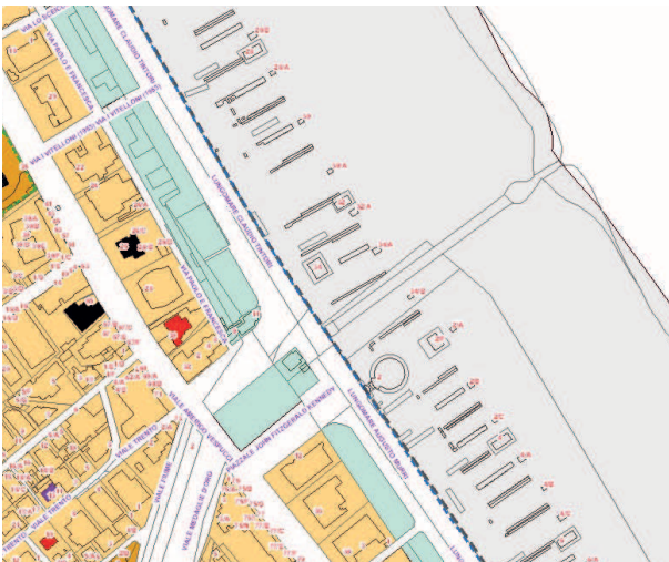
Estratto di RUE