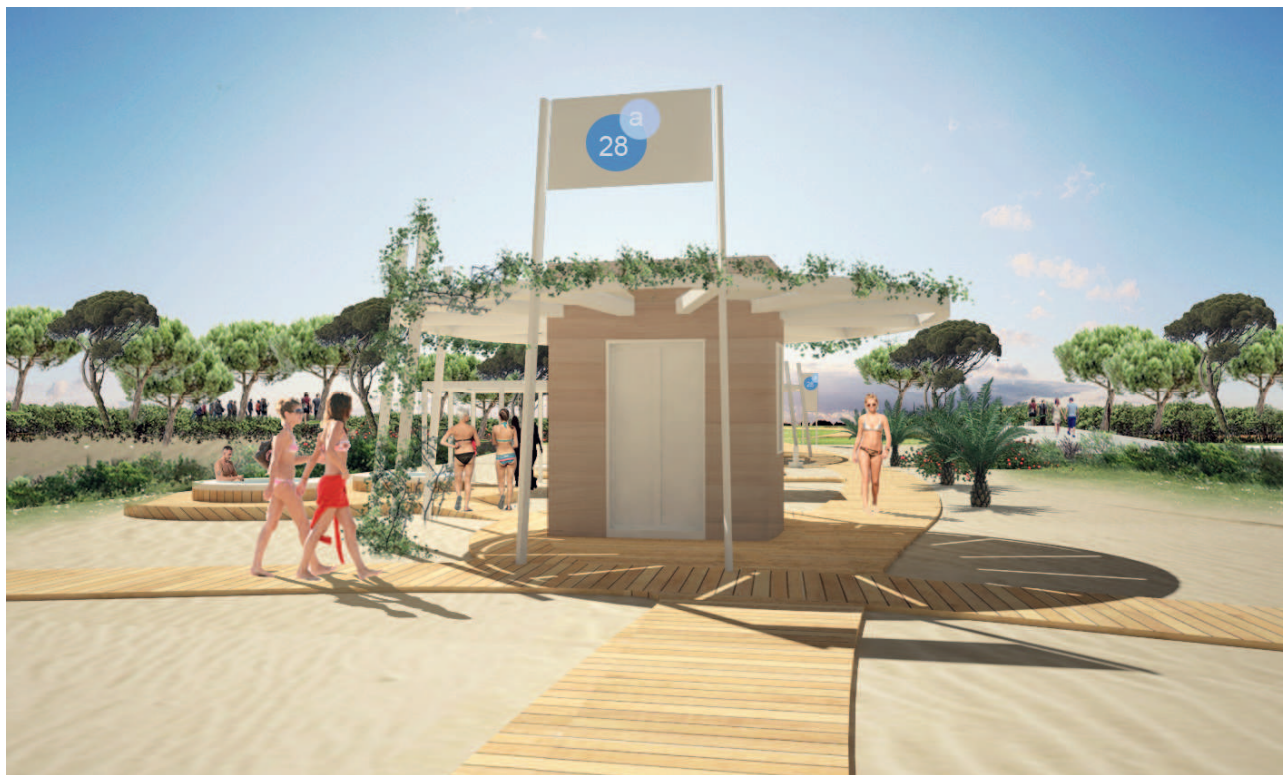
Effetti conseguenti alla realizzazione dell'opera: Simulazione grafica manufatto A

Il primo manufatto (denominato manufatto A), che ospita la direzione dello stabilimento è collocato in prossimità dell'intersezione del percorso longitudinale in "fascia B" e il percorso di "accesso al mare" e ha una superficie coperta di mq. 11,81 mq. è caratterizzato da una copertura circolare in legno che aggetta sul perimetro creando così una struttura ombreggiante funzionale allo svolgimento delle attività di gestione dello stabilimento balneare.