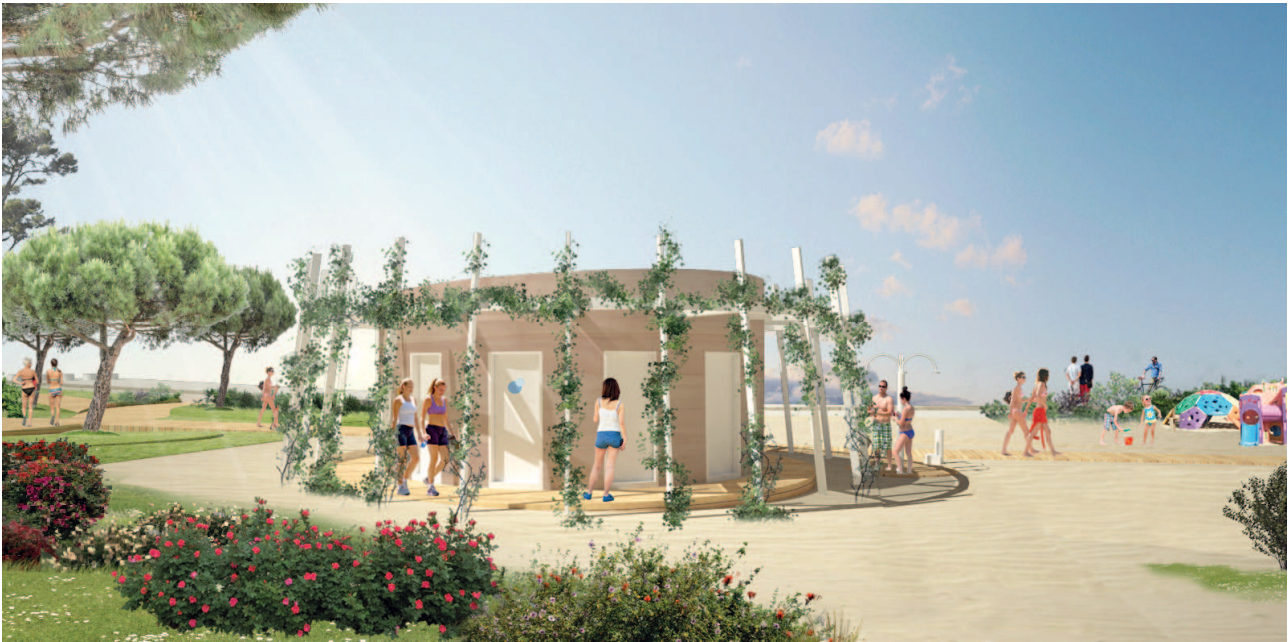
Effetti conseguenti alla realizzazione dell'opera: Simulazione grafica manufatto B

Tutti e due i manufatti saranno rivestiti in doghe di legno naturale trattato, sulle coperture verranno collocati gli impianti (fotovoltaico, pannelli solari, Wi-Fi, illuminazione, videosorveglianza ecc.) e saranno caratterizzati nella loro composizione, come detto in precedenza, dagli oggetti ombreggianti e dal verde "rampicante". Per i manufatti, nonché per le docce aperte è previsto il recupero delle acque grigie e la realizzazione di apposito impianto di irrigazione per il mantenimento delle piantumazioni presenti in fascia "A".