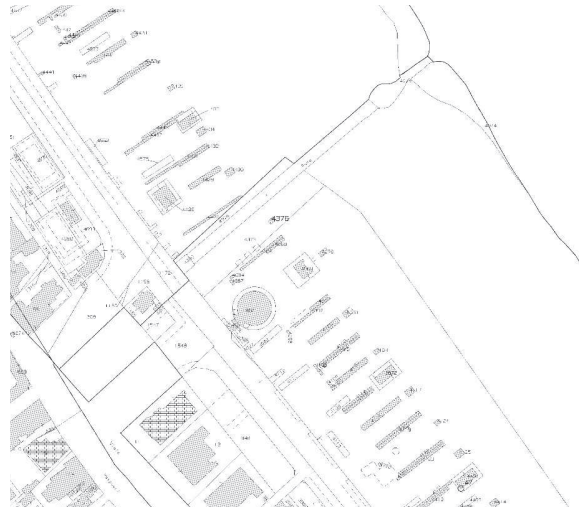
Estratto di mappa catastale