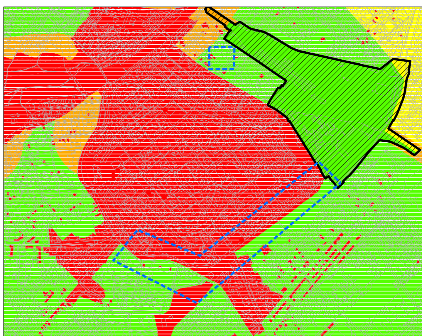
Villa Chiara - VIGENTE